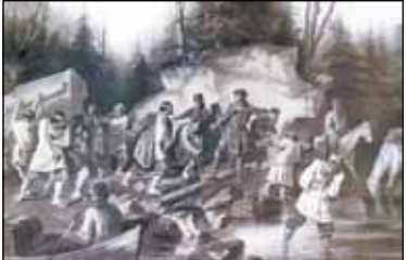
Петр I перетаскивает суда из Онежского залива в Онежское озеро в 1702 году. 1872. художник В.И. Суриков

24 мая 1702 года фрегаты в присутствии царя были спущены на воду. Морем фрегаты перешли к южному берегу до пристани Нюхча. Чтобы продолжить путь и перетаскать корабли из Белого моря в Повенец на Онежском озере петровские солдаты и местные крестья-