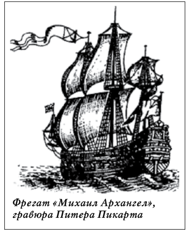
Фрегат «Михаил Архангел», гравюра Питера Пикарта

ительство фрегатов затянулось, «Михаил Архангел» вступил в строй лишь летом 1704 года, а «Иван-город» — летом 1705 г. Как и предыдущая пара, эти фрегаты также не отличались качеством постройки. О боевых делах «Иван-города» сведения отсутствуют. «Архангел Михаил» в 1705-1710 гг. с мая по октябрь выходил с эскадрой к Кроншлоту для защиты Санкт-Петербурга с моря, под командованием П. Фока в составе эскадры вице-адмирала К.И. Крюйса 17 и 21 июня 1705 года и участвовал в отражении нападения шведской эскадры адмирала Ан-