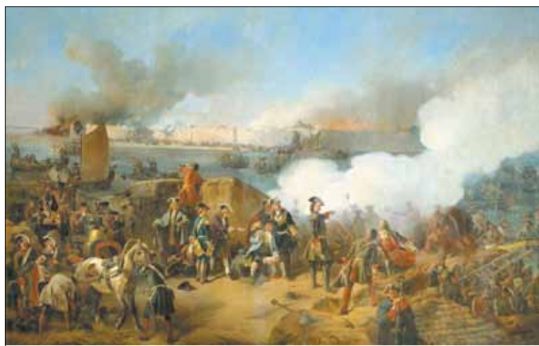
Штурм крепости Нотебург 11 октября 1702 года. Художник А.Е. Коцебу, 1846.

О службе первых фрегатов Балтийского флота известно не много. В июне 1703 г. на них была доставлена в только что основанный город