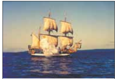
Клуб «Полярный Одиссей» и фирма «Карелия-ТАМП» в 1992 г. воссоздали на судостроительном заводе «Авангард» фрегат «Святой Дух»